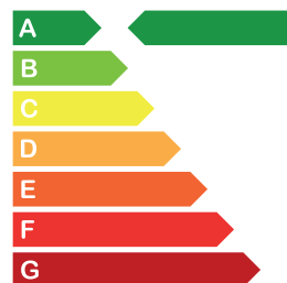
Consumo de energía primaria no renovable