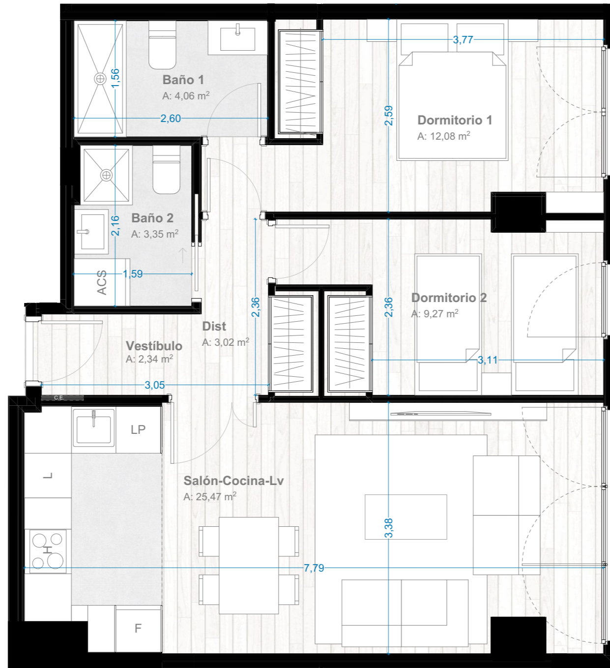
*Salón-Cocina-Lv: Superficie integrada de salón + cocina + lavadero

PARCELA RL-A del P.E.R.I. SUNC-R-R.5 "Martiricos" Dos torres de viviendas y hotel. Paseo de Martiricos nº 30, Málaga.