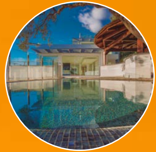
NEW ALOES RESIDENCE