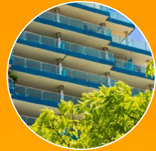
GRAND OCEAN PLAZA