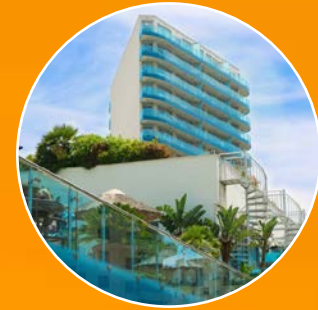
MAJESTIC OCEAN PLAZA