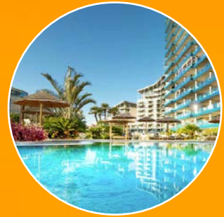
ROYAL OCEAN PLAZA