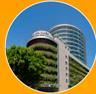
OCEAN SPA PLAZA