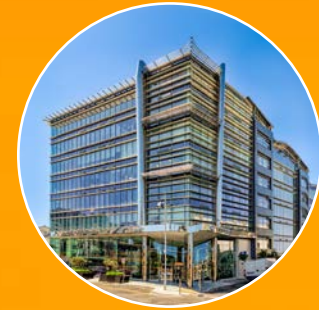
WORLD TRADE CENTER GIBRALTAR